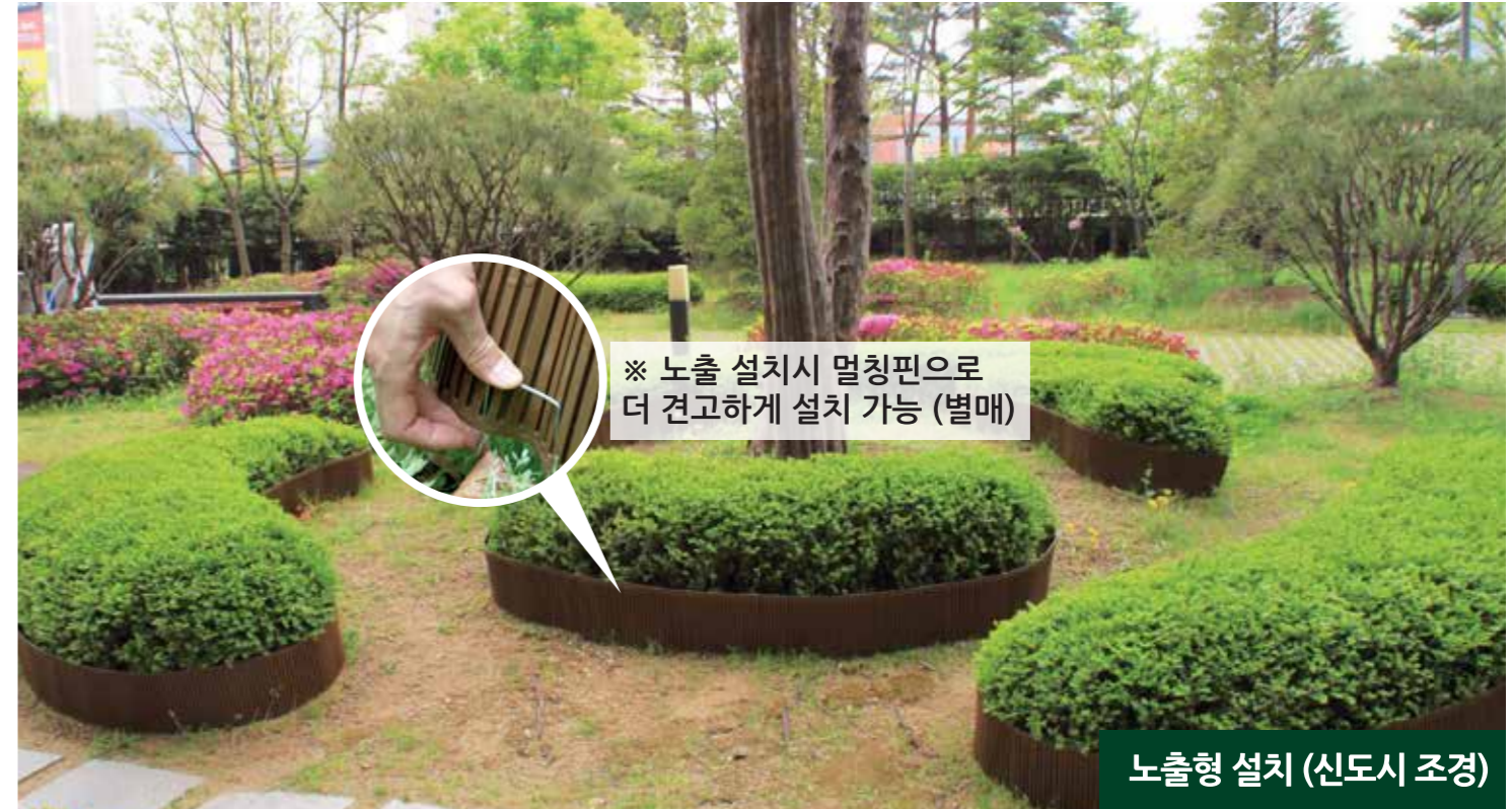
노출형 설치 (신도시 조경)